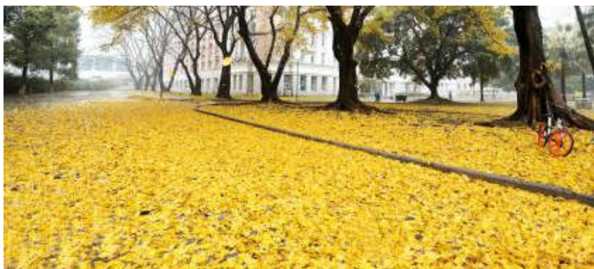
一夜春雨遍地金黄，最美华师惊艳了广州城！