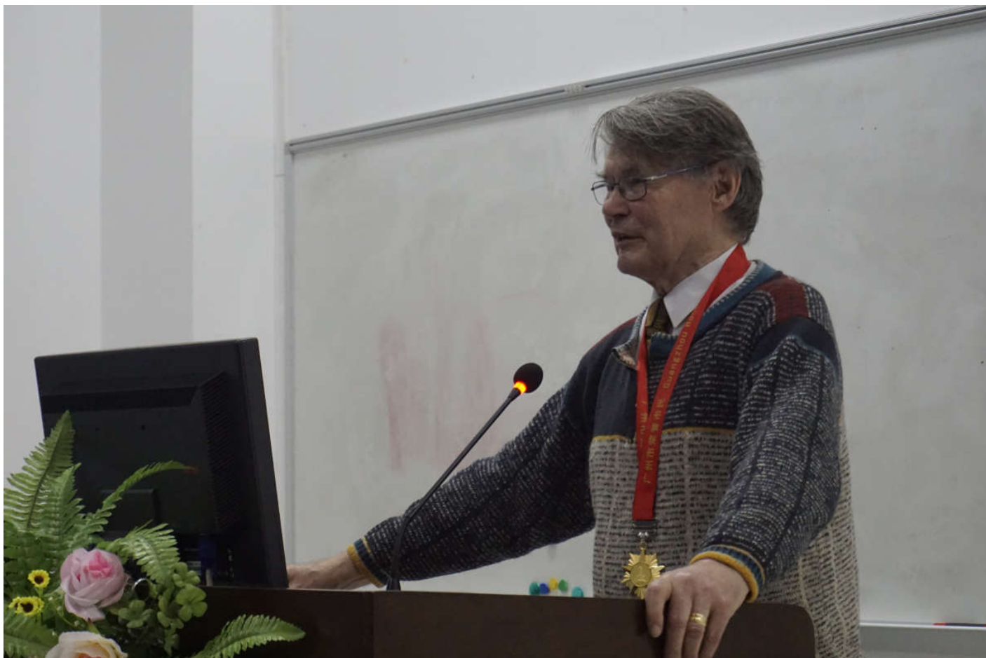
诺贝尔奖评委拉斯·奥尔夫·彼昂在我院作 “The Nobel Prizes 2015” 报告