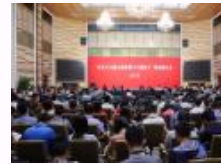
北京大学召开“社会主义核心价值观与立德树人”