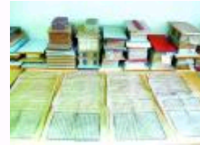
中国百年来首次大批量回购海外中华典籍回归