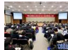
中国人类学民族学研究会民族关系专业委员会成立