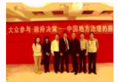
“北大政治学论坛”首场报告会