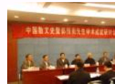
中国散文史暨郭预衡先生学术成就研讨会综述