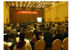
“文艺学新问题与教学改革”学术研讨会顺利召开