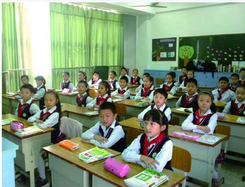
■传统的课堂教学中，教师站在讲台前，学生坐在课桌前，这种传统的教学模式，忽视了学生的身体主体性。 次到同以

【核心提示】 为深化基础教育课程改革，身体之于教学的理论议题亟待关注，若传统贬抑身体的教学思维仍然存在，那么所谓的教学方式变革就会流于“非此即彼”的形式。