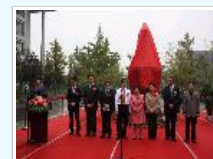
成都电视台：孙中山孙