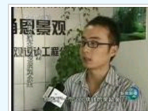
中央电视台新闻联播