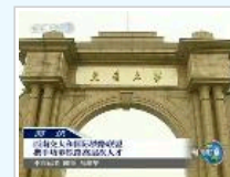
中央电视台新闻联播：