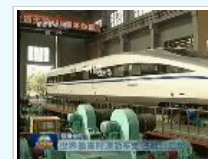
央视新闻联播：世界最