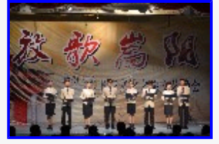
“放歌嵩阳”郑州大学九江学院书院文化之旅专场文艺晚会剧照