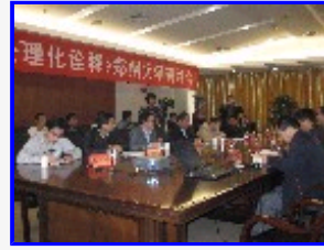
“书院文化与儒家学理研讨会”现场