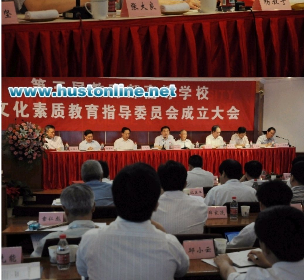
(作者: 文/王潇潇)