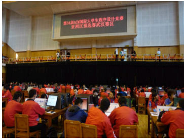
130支队武大争夺计算...