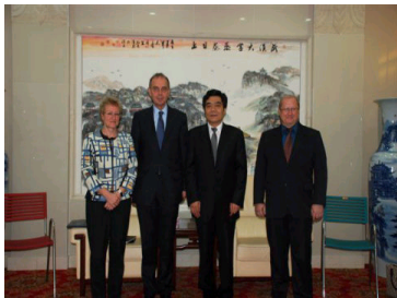
德国德累斯顿工业大学...