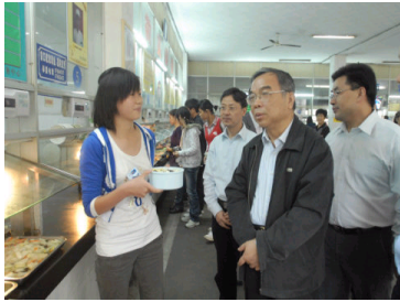
学校领导实地调研学生...