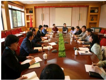
部属在汉高校人事工作...