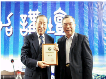
李学勤教授做客珞珈讲...