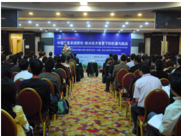
国内外专家汇聚武大研...