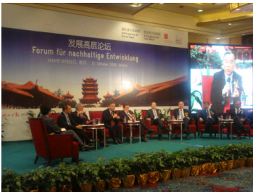
中德官员学者在汉纵论...