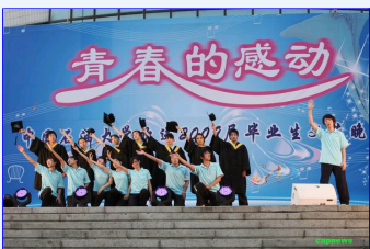
我校举行欢送2009届毕业生文艺晚会