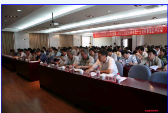
我校召开学习实践活动分析检查阶段总结暨校领导班子分析检查报告评议大会