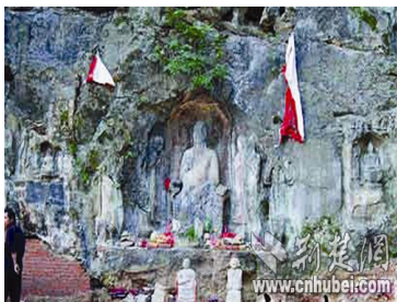
武大教授欲解千年女...