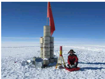
中国南极昆仑站开站 ...