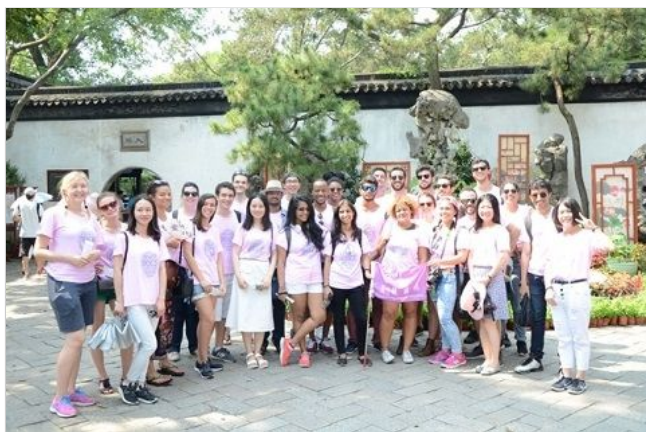
2016年金砖国家项目学员赴苏州文化考察

重要的当下。”他希望能够和世界各地的优秀学生、学者就相关领域的课题充分探讨，交换意见。另外，复旦大学优秀的教学质量和丰富的教学资源也吸引了他，“我非常想认识复旦的教授，和他们交流，也希望在这里感受国际化的学习氛围。”