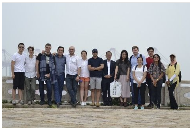
“一带一路”项目学员赴洋山港调研

课程设置方面,项目针对中国新常态的发展实际、外交战略和“一带一路”沿线国家国情,将重点研讨中国全面发展的现状和合作推动“一带一路”战略。项目分为“中国的政治体制改革与发展”“中国经济转型发展与创新驱动战略”“中国社会治理体系现代化”“中国文化遗产与现代化发展”“中国新型外交战略”“‘一带一路’国家国情观察”“‘一带一路’国家区域合作与共享发展”等七大模块,包含18个专题课程和4个学员展示主题。