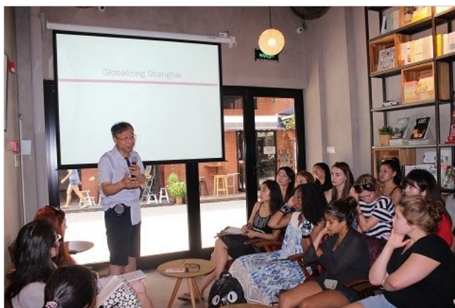
2016年北美项目学员在半层书店学习中国社会与文化

2017年的复旦国际暑期课程为期四周, 开设17门英文授课的专业课程, 涵盖“历史与文化”“社会与政治”“商务与经济”“科学与技术”四个板块。除了专业课程, 项目开设初级、中级和高级三个层次的中文课程, 以及两门体育课程。每名学生可以修读1-3门专业课, 中文课和体育课为选修。2017年的复旦国际暑期课程共招收来自35个国家的300余名学生, 包括上海暑期学校奖学金资助的40名北美地区的学生, 和来自复旦大学国外合作伙伴的69名交换生、来自香港各高校的54名学生。