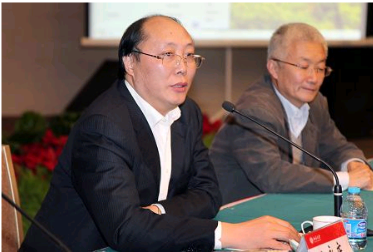
中共中央统战部六局局长王永庆讲话

中共中央统战部六局局长王永庆讲话。他表示在北大的观摩会虽然时间不长，但信息量大，北大各民主党派组织创造了许多好经验、好方法，对全国各地、各高校都有很多借鉴意义，希望大家回去后能够认真体会、学习借鉴。