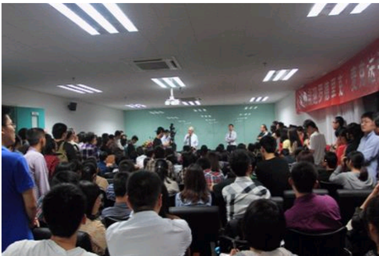
容纳百人的学术报告厅挤满了听众

在将近两个小时的时间里，麦克法夸尔教授结合1949年中国建立的政治制度和社会结构，运用“铁三角”理论对中国的政治社会变迁的历史进行分析，对其前景及其中存在的问题进行了解释。同时，他还把中国的“三角”结构与西方某些国家的“三角”结构进行了比较，解释了其中的差异。在演讲结束后，麦克法夸尔教授认真地回答了学生们的提问。