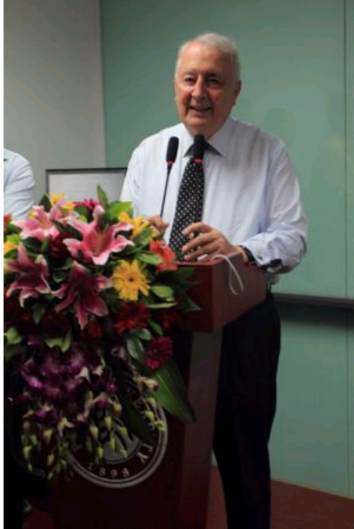
年逾八旬的麦克法夸尔教授在演讲

在将近两个小时的时间里，麦克法夸尔教授结合1949年中国建立的政治制度和社会结构，运用“铁三角”理论对中国的政治社会变迁的历史进行分析，对其前景及其中存在的问题进行了解释。同时，他还把中国的“三角”结构与西方某些国家的“三角”结构进行了比较，解释了其中的差异。在演讲结束后，麦克法夸尔教授认真地回答了学生们的提问。