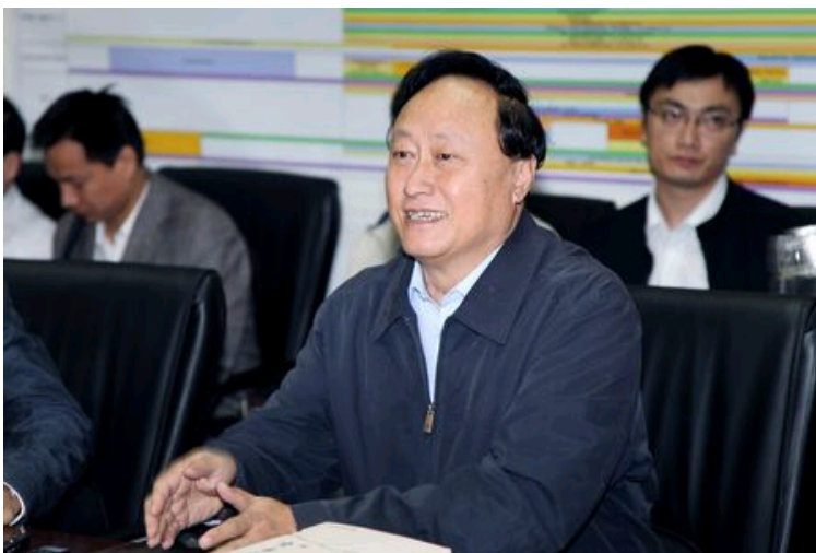
朱善璐书记出席座谈会并讲话

座谈会上，朱善璐书记高度评价参加支教服务团及其它社会实践活动的同学所取得的成绩。朱书记指出，胡锦