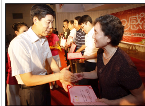
天津大学举行第四届“...