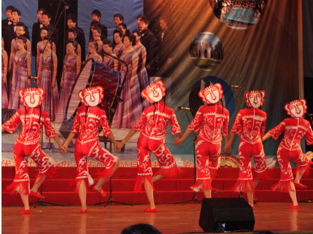
精彩的演出

据悉，“希望之星”奖学金由北京校友会于2007年设立，旨在鼓励更多北京籍优秀中学生报考天津大学，并激励他们在校期间继续刻苦学习、立志成才、报效国家。该奖学金至今已颁发了5届，奖励优秀学子65名。