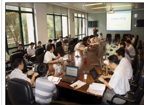
以人才培养为中心推进...