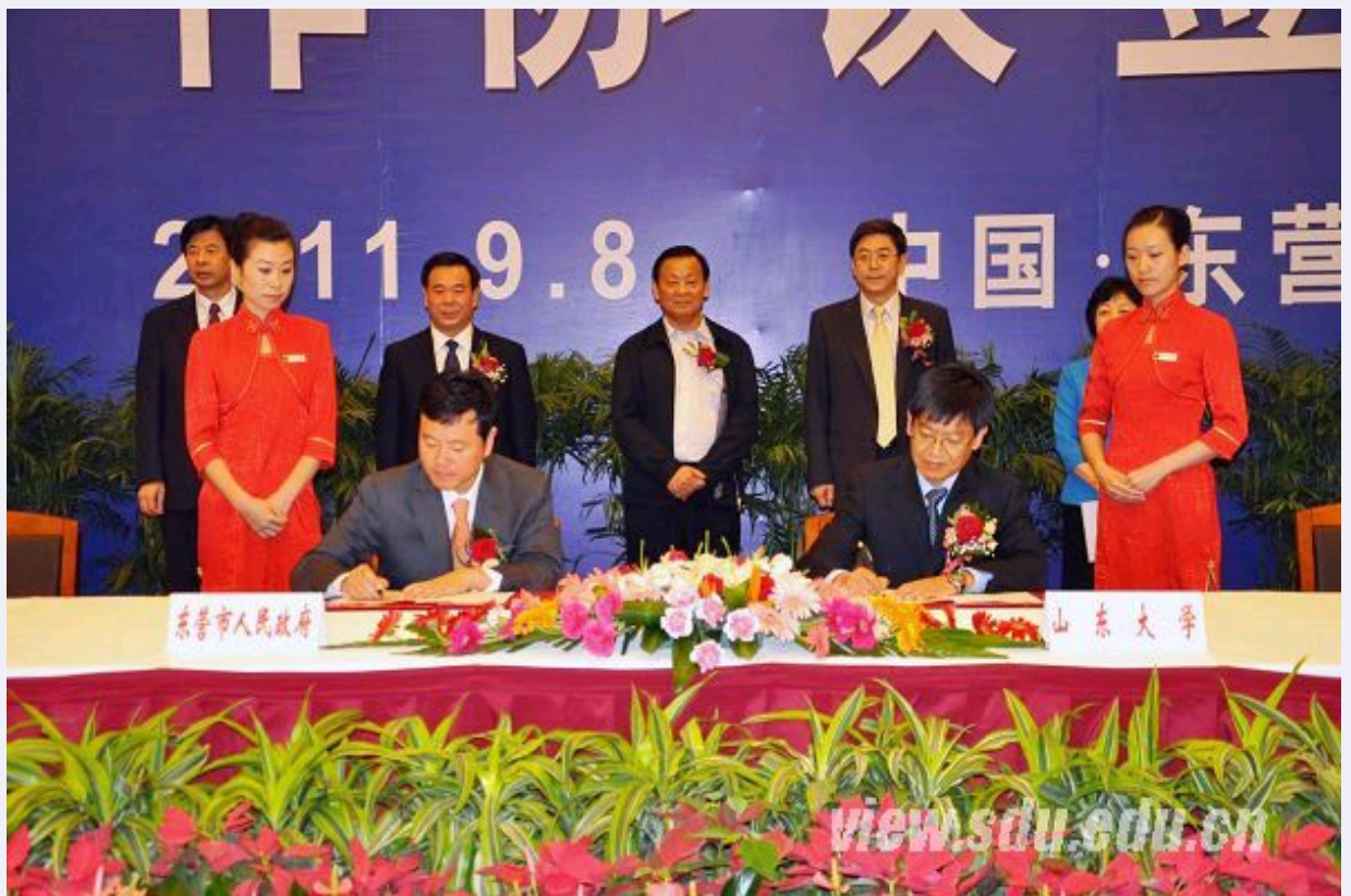
山东大学副校长姜红祥（前排右）与东营市副市长、经济开发区管委会主任李金昆（前排左）签署共建山东大学研究院协议

仪式上，山东大学副校长樊丽明和东营市委常委、副市长曹连杰代表双方发表讲话。樊丽明表示，山东大学致力于与东营的全面务实合作，是落实胡锦涛总书记在清华大学百年校庆上的讲话精神的重大举措。“黄蓝战略”的伟大实践，必将给山大服务社会提供一个更加广阔的舞台，必将为高等教育的改革和创新注入强大活力。曹连杰表示，东营市将在人才培养、科学研究、成果转化等方面，加强与山东大学全方位的合作，本着“真诚合作、共同发展”的理念，努力探索市校合作新机制。