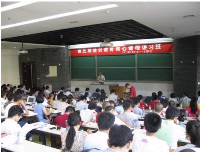
第五届通识教育核心课程讲习班开幕式现场

2011年7月31日，由中国文化论坛、北京大学、中山大学合办的第五届通识教育核心课程讲习班在北京大学第二教学楼105室举行。本次讲习班共录取来自全国各高校的230余位学员，北京大学副校长王恩哥，教务部部长方新贵、副部长强世功，中国文化论坛理事长董秀玉，中山大学博雅学院院长甘阳，北京大学批评理论中心主任张旭东，北京大学教务长办公室主任李祎，北京大学历史系阎步克教授，北京大学批评理论中心副主任、中文系党委书记蒋朗朗等嘉宾出席开幕式，开幕式由张旭东主持。