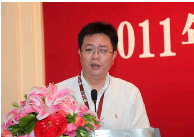
北京大学副校长李岩松讲话

北京大学是最早面向港澳台地区招生的大陆高校，自上世纪八十年代起，北大就开始招收港澳台学生。目前，共有588名来自港澳台地区的全日制学生在北大学习，分布在五大学部30个院、系所、中心，其中社会科学部47%，人文学部22%，医学部18%，理学部10%，信息与工程科学部3%。