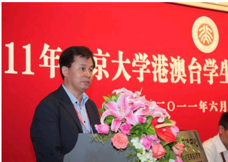
国务院港澳事务办公室交流司副司长钟毅讲话