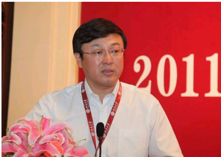
教育部港澳台事务办公室副主任李大光讲话