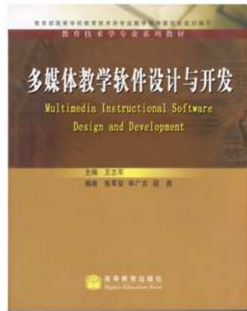
本课程教师编著的主体教材