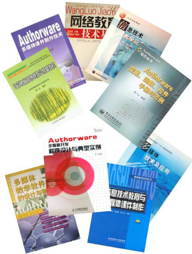
本课程教师编著的辅助性教材