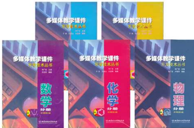
本课程教师编著的实践指导教材