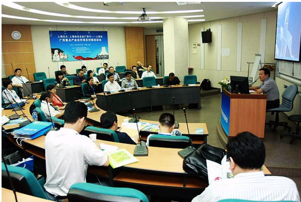
企业家们根据投资意向，分组交流

支持与协调，希望企业家们能借助此次合作平台，为广西的经济发展贡献一份力量，实现双赢。