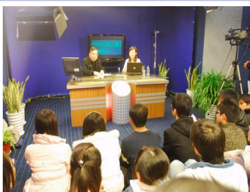
武大学子与顾海良校长...

关于今后的科技工作，顾海良提出三点要求，一是要提升发展思路。要注重从数量型到质量型的转变，把人才的成长、发展和引进作为科研工作及学校发展的重中之重，把今后几年的科研工作的重点放在人才培养和引进，特别是杰出人才团队的引进和培养上，并妥善处理好基础研究与应用研究、教学与科研、成果产出与评价三方面的关系。二是要提高管理水平。要做到统筹兼顾，统一协调，形成分级、分类、分层管理模式。对分级、分类、分层管理的学院进行统筹兼顾，加强协调，通过有效的管理，让各个学科都有发展的自豪感。三是要破解发展难题。学校领导、管理部门和院系的负责人、教师要团结一致，通过解决存在的矛盾和问题，共同破解科研工作中遇到的难题。破解难题的思路是，要有利于科研的发展，有利于杰出人才团队的成长，有利于优秀科研成果的产出。顾海良最后强调指出，“人是