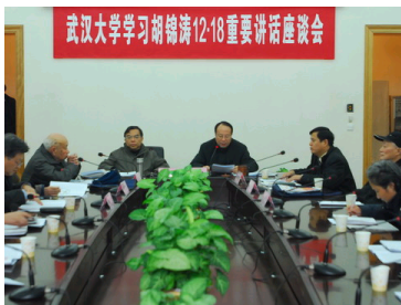
武大召开学习胡锦涛12...