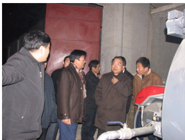
文理学部北三区锅炉房...