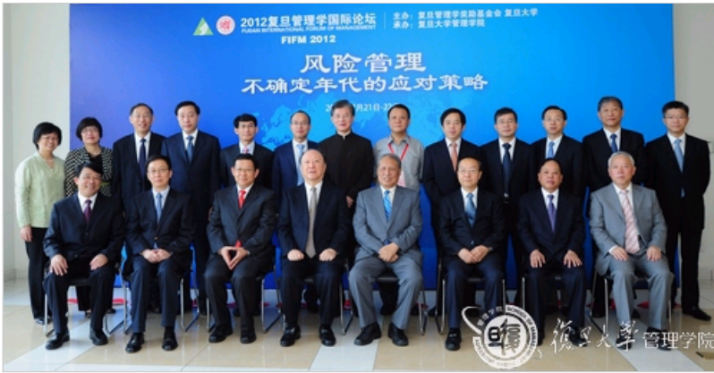
复旦管理学国际论坛与会嘉宾合影

7月21日至22日，由复旦管理学奖励基金会以及我校主办、管理学院承办的2012复旦管理学国际论坛以“风险管理：不确定年代的应对策略”为主题在我校隆重举行。第十届全国政协副主席徐匡迪，第九、十届全国人大常委会副委员长成思危，中华人民共和国商务部部长陈德铭，全国政协经济委员会副主任李毅中，上海市市长韩正，我校党委书记朱之文，管理学院陆雄文院长，以及部分海内外知名大学管理学领域著名学者、知名企业领袖等出席了本次论坛。