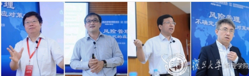
(左起)中国科学院研究生院管理学院汪寿阳、新加坡国立大学张俊标、东北大学唐立新、管理学院胡建强教授分别就自身的学术研究领域做了专题报告

22日上午,论坛学术专场报告会在管理学院友邦堂如期举行。管理学院胡奇英教授主持了本次报告会,中国科学院研究生院管理学院汪寿阳、新加坡国立大学张俊标、东北大学唐立新和管理学院胡建强四位教授分别就自身的学术研究领域做了专题报告。