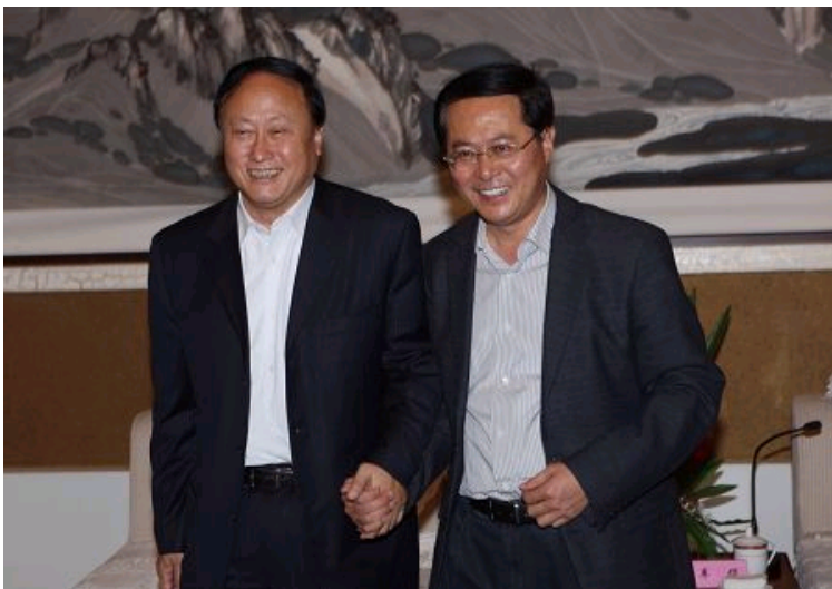
朱善璐书记与新疆生产建设兵团政委车俊进行亲切会谈

10月11日上午，朱善璐书记一行与新疆生产建设兵团政委车俊等进行了亲切会谈。新疆生产建设兵团副司令宋建业，教育局局长高继宏，新疆石河子大学党委书记何慧星，副校长夏文斌等参加会谈。