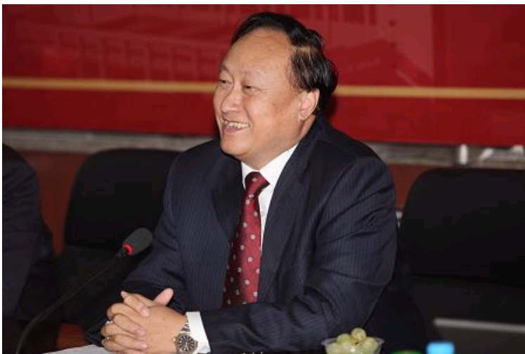
朱善璐书记在工作例会上发言

朱书记在工作例会上作重要发言。他表示，对口支援石河子大学，事关整个新疆乃至西部地区的稳定与发展，在国家西部大开发战略和保障边疆安宁稳定的政策中具有特殊地位和不可或缺的重要作用，作为高校团队组长单位，北大深感任务光荣，责任重大，北大今后还将继续努力，与高校团队一起，探索新一轮对口支援的有效途径，进一步推进对口支援石河子大学的工作，促进石河子大学的建设和发展。