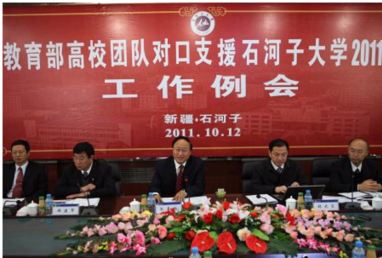
教育部对口支援石河子大学高校团队工作例会

起，教育部安排北大为组长单位，华中科技大学等八所高校为成员单位，共同对口支援石河子大学，改变了过去由北大一家对口支援的方式。