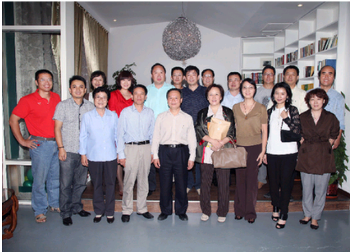
中心特聘研究员与嘉宾合影

周其凤校长在听取中心工作汇报后，肯定了中心六年来学术科研的丰厚成果和一系列活动的积极社会影响，并对研究员一直以来的积极支持和付出表示由衷感谢。他指出，艺术创造与科学研究具有共通性，应当从科学家的视角为中心未来发展打开思路。在媒介日趋融合和激烈竞争的今天，有序与无序的事物都共同推进了媒介的进步，要鼓励百花齐放的态度，也要有冷静的学术批评的态度。周校长希望，电视研究中心能保持其一贯前沿的学术视角和引领实践的精神使命，为中国电视传媒事业的发展做出更大的贡献。