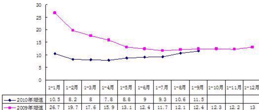
图 3 2009年以来消费品零售额累计增速 (%)

旅游市场人气集聚，成为区域经济产业发展的融合器。初步统计，1-3季度，全县旅游业接待游人552万人次，同比增长13.2%；实现旅游综合收入8.8亿元，增长16.2%。以农业观光、采摘、垂钓、农耕体验等为载体的乡村游融合第一产业，1-3季度，全县乡村旅游（农业观光园和民俗户）接待游人330万人次，同比增长11.8%；实现综合收入1.9亿元，增长17.9%。以种植、观光、制造和销售为一体的都市型工业融合了一、二、三产业，如密云县的红酒产业，1-3季度累计实现综合收入1.6亿元，比上年同期增长1.2倍。密云县绿色休闲产业——旅游业已成为区域优化产业结构的融合器。