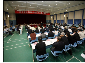
• 社会各界隆重纪念张含...