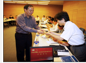
• 【三强工程】天津大学...