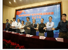
• 天津大学发起成立战略...