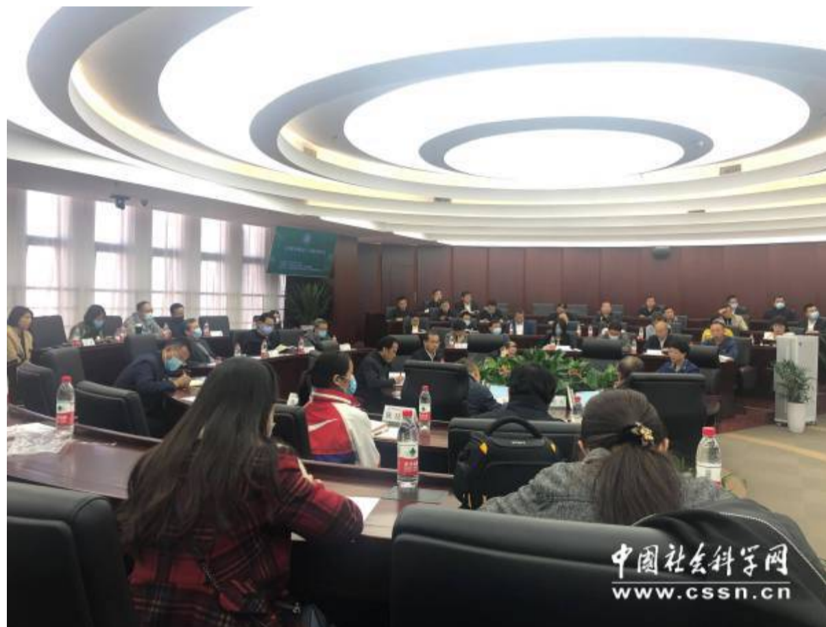
出版座谈会现场图

中国社会科学网讯 （记者吴屹校）10月23日，中国劳动关系学院和人民出版社主办、中国劳动关系学院大国工匠与劳动模范研究所协办的《劳模学概论》出版座谈会在京举行。全国总工会兼职副主席高凤林，中国劳动关系学院党委书记刘向兵研究员，人民出版社副总编辑陈鹏鸣，中国社会科学院当代中国研究所副所长武力研究员，中国劳动关系学院党委常委、科研处处长燕晓飞教授，中国劳动关系学院党委常委、马克思主义学院院长、大国工匠与劳动模范研究所所长杨冬梅教授出席会议。