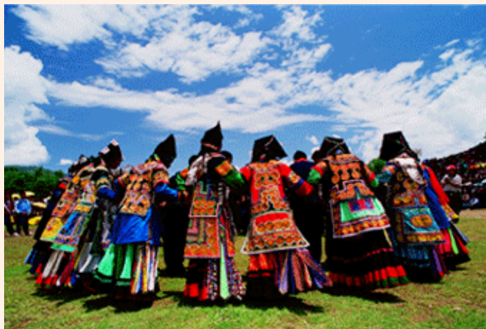
艳如山花的彝族服饰