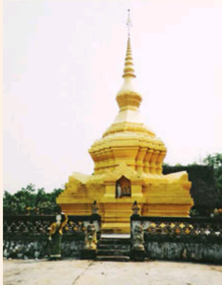
勐心是一个勐生命的标志

傣语将“寨”称呼为“曼”。一座傣族村寨，一定有几个不可或缺的元素。一是位于村寨周围丘陵和山地上的“龙林”，意为“寨神林”。这里是村寨保护神的居住地，保护着村寨的平安。二是坟林，多位于村寨的左右两侧，这里是人们去世之后安息的所在。三是佛寺，位于村寨入口或者村寨中地理位置较高的地方，那里在人们心目中是傣族的象征，是他们精神的绿洲所在。四是每家每户的竹楼，这种建筑被人们称为干栏式建筑，很早就见于古代史籍中，是一种古老的建筑形式，十分适合傣族所居住的热带地区，通风凉爽。五是位于寨脚的大片水田，这是傣族人生计的来源。