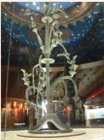
高达3.96米的青铜神树

这些人头像形式多样，装扮各异。有的头戴辫状“帽箍”，与今天大小凉山彝族同胞头上缠绕的头巾极为相似，这种辫状帽彝语称“俄体”；还有圆圆的头顶上将发梢聚成一撮，王昌富说，这可能就是《史记》所记载的西南夷的“椎髻”。这些不同发式和不同冠式的青铜人头像，表现的是人们不同的身份和职责。这也说明了古蜀国已进入了高度发达的阶级社会。出土人物多为头像，王昌富认为，这也印证了彝人“顾头不顾足”的历史渊源。