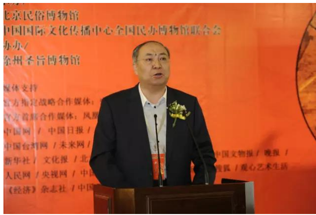
中国民俗学会会长朝戈金致辞