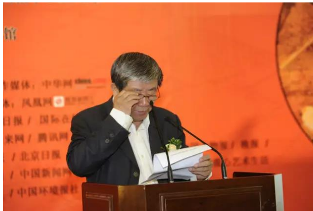
全国政协委员国家文物局原副局长张柏致辞