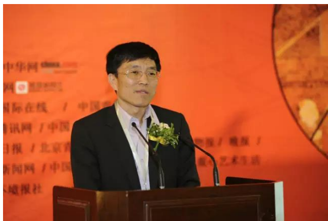
中国民俗学会副会长、秘书长叶涛发言