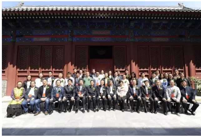
与会嘉宾集体合影

当前，优秀传统文化的传承发展已经全面上升为国家层面的战略与行动。在此背景下，此次会议是对习近平总书记系列重要讲话中提出的文物工作要紧紧围绕“五位一体”的总体布局和“四个全面”战略布局，牢固树立创新、协调、绿色、开放、共享的发展理念，要在建设“一带一路”文化遗产长廊中发挥积极作用等要求的践行。而成立后的中国民俗博物馆联盟也将通过一系列举措，大大推动全国范围内的民俗文物资源的整合、国有和非国有博物馆间合作交流机制的建立、优秀公共文化产品的普惠共享。