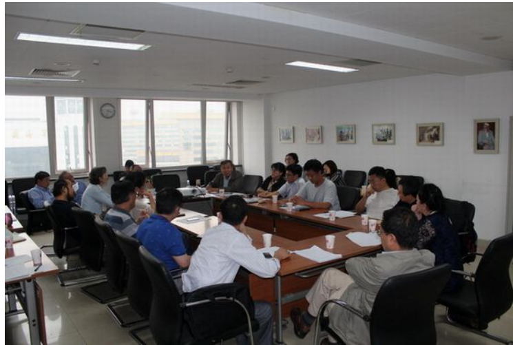
(中国民俗学会秘书处供稿)