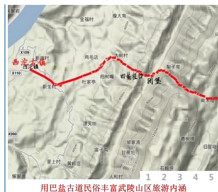
用巴盐古道民俗丰富武陵山区旅游内涵