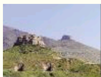
日月山下的绥戎城