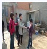
根据这项制度的有