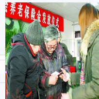
明年我省符合条件