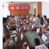
加快社会保障体系