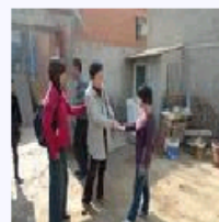
根据这项制度的有