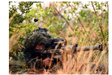
狙击手实弹射击现场