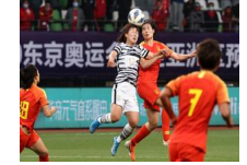
中国女足战胜韩国晋级