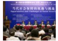
第十届社会保障国际论坛在京举行 聚议当代社会