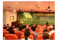
中外专家聚会西北农林科技大学探讨农村金融创新