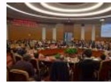
2014传媒高等教育国际论坛暨国际传媒教育学院成