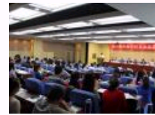
第一届中国农村社会发展论坛在西北农林科技大学