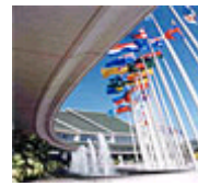
亚太经社会曼谷总部

2008年9月22日 亚太地区国际移民与发展问题高级别会议星期一在泰国曼谷召开。会议将以亚太区域为背景，探讨移民与社会经济发展之间的相互关系，并讨论如何加强亚太国家之间的相互合作，以更好地管理移民问题，充分发挥移民对于减少贫困的作用。