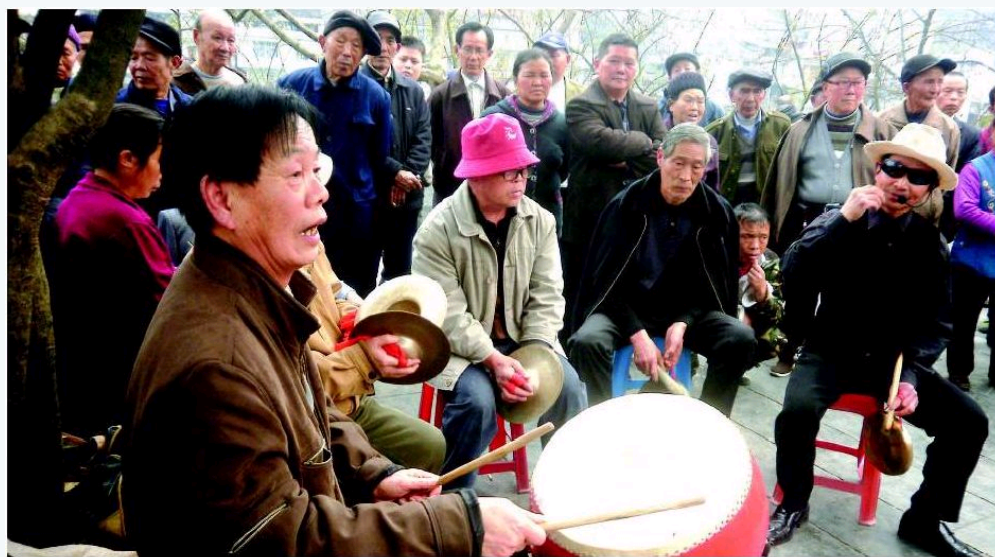
■ 高龄劳动人口迅速增长会导致劳动参与率下降。

【核心提示】 人口老龄化深度发展的后果之一就是人口增长的衰减或停滞，这种趋势可能引起产业结构的重大改变。人口增长对抵消引起经济危机的消费不足趋势曾经是一个重要因素。