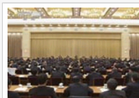
中央经济工作会议