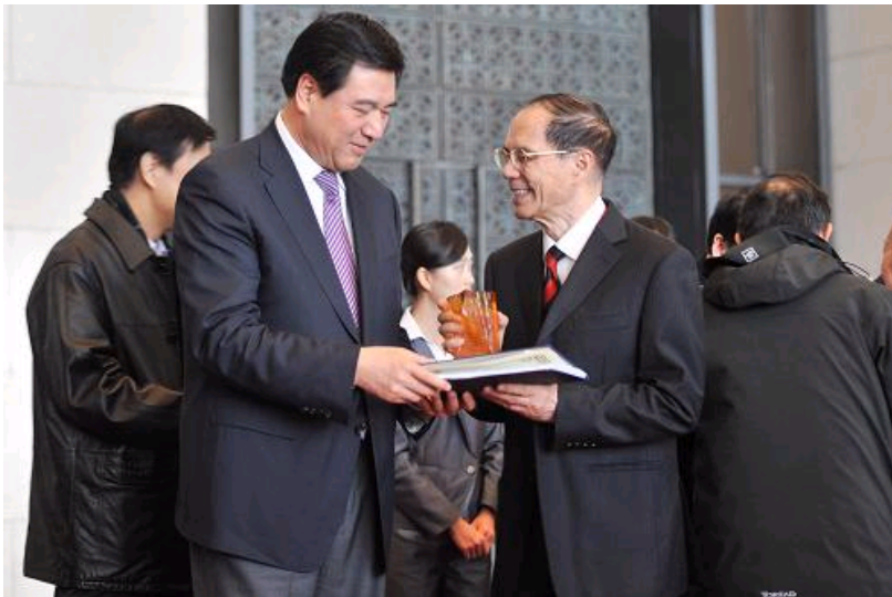
12月15日，中国科协党组书记申维辰（前左）向中国科学院院士韩济生颁发“老科学家学术成长资料采集工程”捐赠证书和纪念品。

“走进主题展，走近一位位个性鲜明事迹感人的科学家，走近他们的学术生涯和精神世界，都能够深刻感受到百年以来中国科学事业的艰难与梦想、奋进与辉煌，都会引发我们对中国科学家的历史命运、历史责任和历史担当的深深思考。”中国科协党组书记申维辰说。作为2013年中国科协会员日期间的重要活动之一，主题展是勉励广大科技工作者用“科技梦”助推“中国梦”的一次再动员。