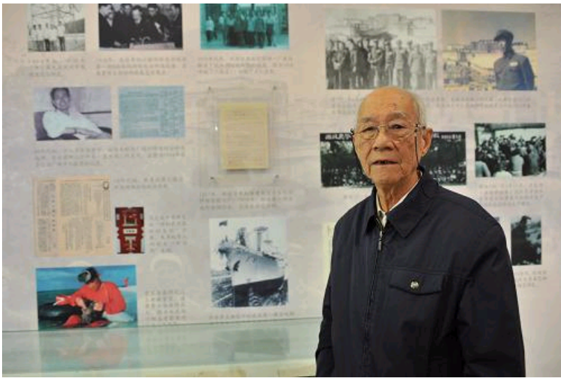
12月15日，中国科学院院士郁铭芳在展出的他的论文手稿旁留影。