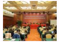
第四届外语院校发展哲学社会科学高层论坛举行