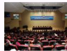
外语院校智库作用凸显 第五届外语院校繁荣发展