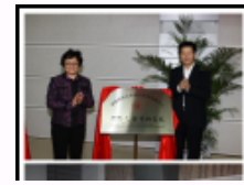
陕西师范大学进一步繁荣发展哲学社会科学