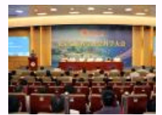
华侨大学隆重召开繁荣发展哲学社会科学大会