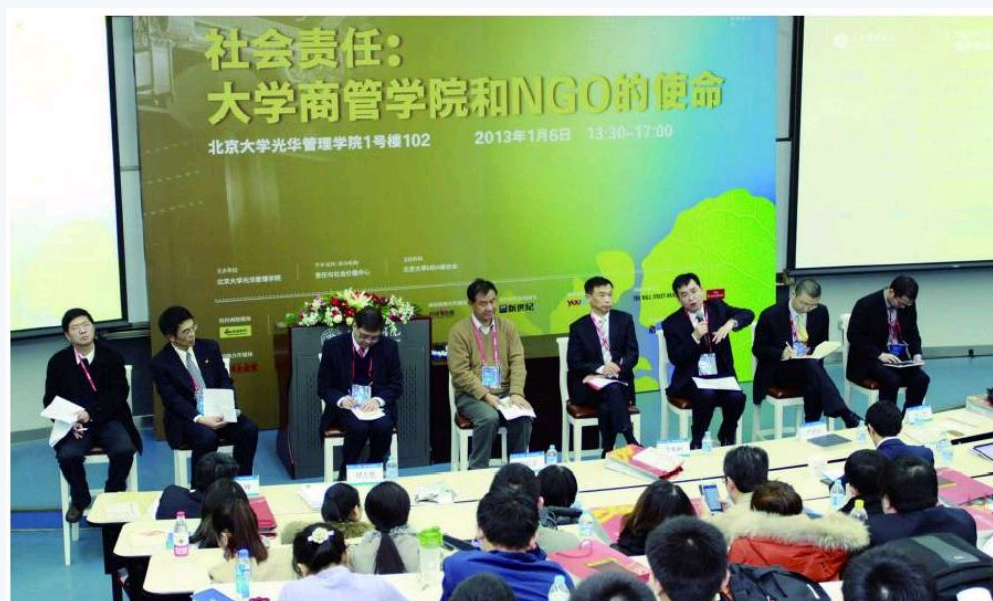
■大学有义务承担更多的社会责任。图为北京大学光华管理学院举办的“社会责任:大学商学院和NGO的使命”论坛现场。资料图片

【核心提示】 我国目前正处于社会发展与改革的关键时期,党的十八大提出了我国各项重大决策与战略部署,在国家的未来发展与建设实施中,作为社会重要知识源泉与思想高地的大学,应该切实承担起应有的责任。