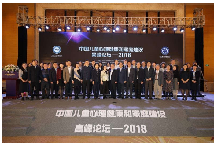
与会领导和专家合影