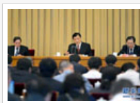
项目评审工作会议