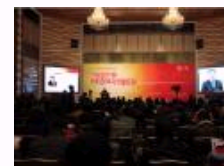
2014第十一届中国文化产业新年论坛北大开幕