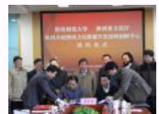
陕西师大与省文化厅签署协议共建陕西文化资源开发