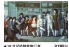
2013国际人文社科盘点