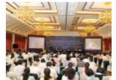
第四届证据理论与科学国际研讨会在京召开