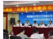
第四届“马克思主义中国化论坛”在吉林大学举办