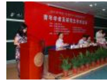
2013年中国“区域科学与城市经济前沿”青年学者