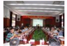
中国学术出版“走出去”高端论坛在上海交大出版