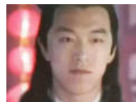
黄渤年轻颜值爆表