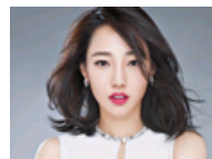
百何长裙随性洒脱