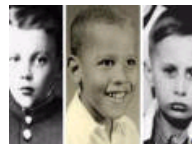
外国政要们童年照