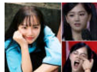
上节目毁掉的女神